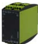
G4UF900V01 Art.Nr. 2394505